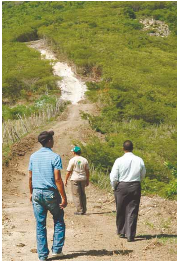
Ecologistas muestran parte del bosque que ha sido afectado.